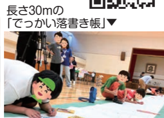
長さ30mの「でっかい落書き帳」▼