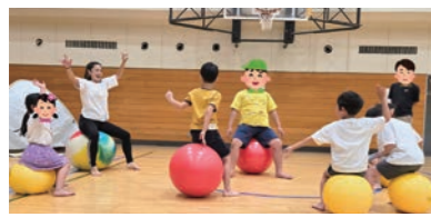
▲バランスボールの体験